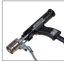
Schweißpistole PH-3N SRM 16 zum Mutter- und Bolzen- schweißen mit magnetisch be- wegtem Lichtbogen PH-3N SRM 16 welding gun for nut and stud welding using a magnetically moved arc