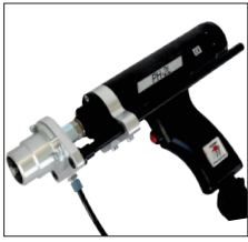
Standardschweißpistole PH-2 PH-2 standard welding gun